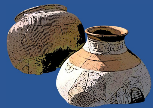
Gestaltung: Kurpfälzisches Museum Heidelberg (W. Henkel)

Bankverbindung: Spar- und Kreditbank Hardt BLZ 660 621 38 Konto Nr. 38172