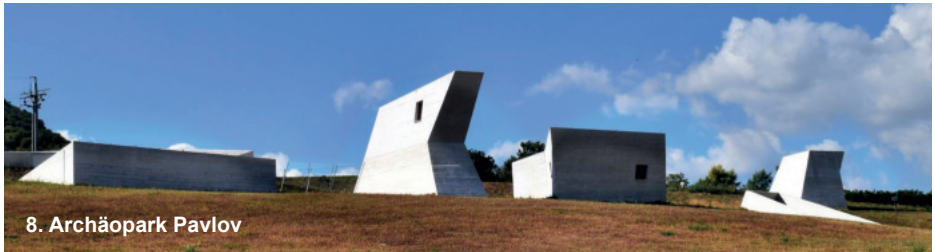
8. Archäopark Pavlov