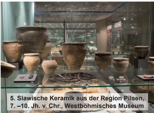
5. Slawische Keramik aus der Region Pilsen, 7. –10. Jh. v. Chr., Westböhmisches Museum

Am Mittwoch erhalten wir eine Führung auf dem Alten Jüdischen Friedhof (starý židovský hřbitov), einem der bedeutendsten jüdischen Friedhöfe Europas, auf dem seit dem 15. Jh. viele bekannte Personen bestattet sind. Je nach aktuellen archäologischen Maßnahmen ist alternativ der Besuch einer laufenden Ausgrabung im Raum Prag möglich.