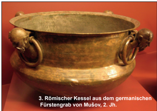
3. Römischer Kessel aus dem germanischen Fürstengrab von Mušov, 2. Jh.