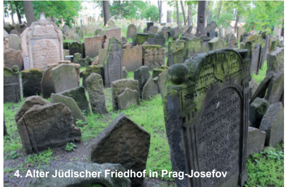
4. Alter Jüdischer Friedhof in Prag-Josefov