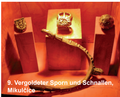
9. Vergoldeter Sporn und Schnallen, Mikulčice

Nach einer Führung im Freilichtmuseum Pavlov, einem Archäopark mit bedeutenden Funden aus der Altsteinzeit, fahren wir weiter in die südmährische Kleinstadt Mikulov, wo wir auf einem Weingut zu Mittag essen. Wir besuchen das Museum auf dem Schloss, in dem bedeutende germanische Funde aus Siedlungen und Gräbern ausgestellt sind, die in Südmähren geborgen wurden. Hervorzuheben ist das Königsgrab von Mušov aus dem späten 2. Jh. nach Christus. Anschließend besichtigen wir das Freilichtmuseum Mikulčice mit einem slawischen Burgwall. Zum Abendessen sind wir zurück im Hotel in Brünn.