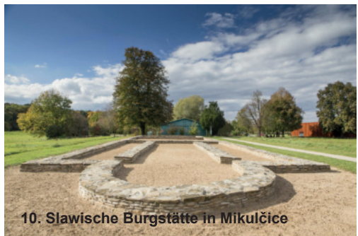
10. Slawische Burgstätte in Mikulčice