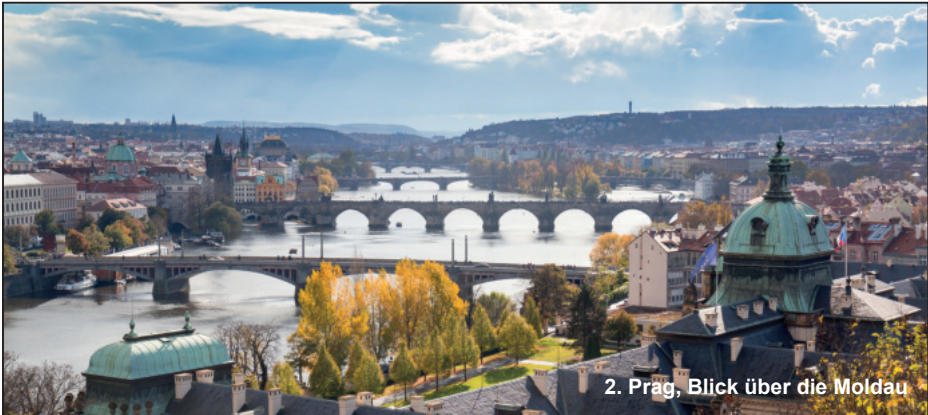
2. Prag, Blick über die Moldau